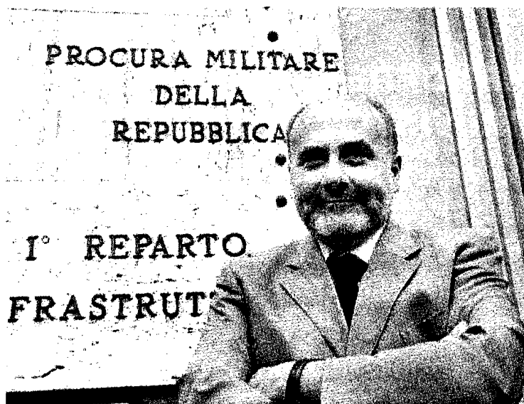
Il sostituto procuratore militare di Torino Paolo Scafi